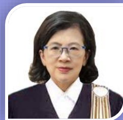
อุปนายก คนที่ ๒ นางสาวนารี ตันทสเสถียร