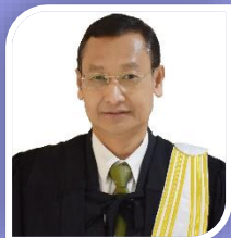
รองเลขาธิการ หม่อมหลวงศุภกิตต์ จรูญโรจน์