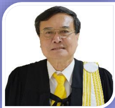
รองเลขาธิการ ว่าที่ร้อยตรีถวัลย์ รุยาพร