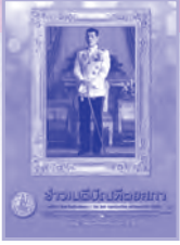
อัครราชกุมารี

ศิริอร เทศะบำรุง มณีนีสินธุ์ วาสนา เกตุแห่ง